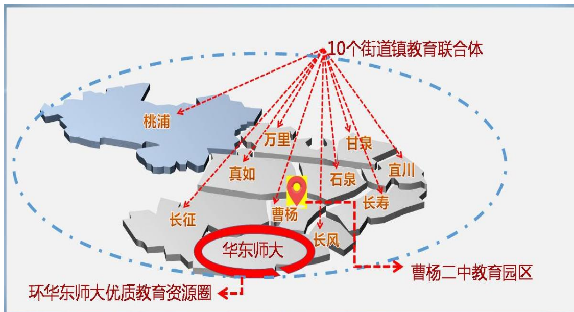
图 3：“一环一园十街镇”布局图

“一环”是指环华东师大优质教育资源圈。其功能重在溢出转化，聚焦于高校与地方政府合作推进的集团化办学模式探索，将周边学校打造成为华东师大基础教育科研成果溢出转化的实验基地，逐步辐射全区、全市乃至全国。