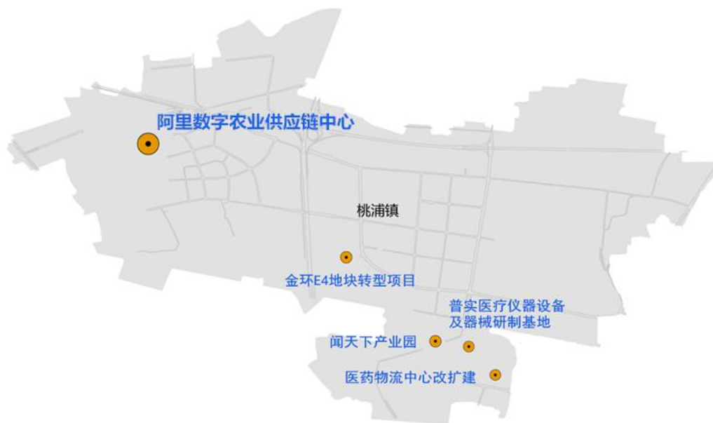
图1 “十四五”桃浦镇产业项目布局图