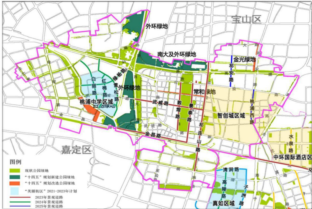
图2 “十四五”桃浦镇绿化建设项目图

持续推进美丽街区建设。 推动实施桃浦中学区域“美丽街区”建设。实施敦煌路、白丽路、桃浦西路等11条景观道路建设。统筹绿化景观、建筑立面、城市家具、店招店牌等要素，加大户外设施和非广告设施的监管整治力度，积极推进“路长制”，加大市容管理的法治化、常态化。着力提升河滨景观，推动亲水平台、景观灯光建设。推进垃圾分类工作常态化、长效化、规范化。持续开展扬尘防治工作，月平均降尘量达到全区考核标准。